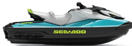
● Azul Teal & Verde Manta