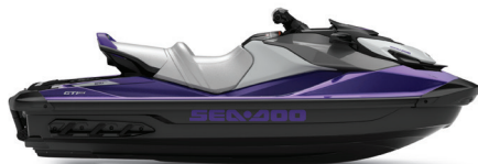
● NOVO Roxo Midnight